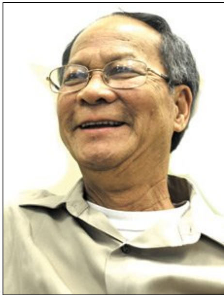
"Hiểu biết bệnh trạng của mình và hợp tác với bác sĩ trong việc chữa trị là một yếu tố quan trọng."

Trải qua những giây phút "thập tử nhất sinh" trong một phòng mổ sáng choang đầy máy móc, để mặc cho toán bác sĩ mổ toang lồng ngực mình ra, loay hoay "sửa chữa" trái tim đang đập một cách vật vã, chắc hẳn không phải là một kinh nghiệm mà ai cũng muốn có.